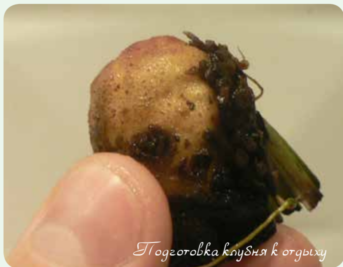
Подготовка клубня к отдыху