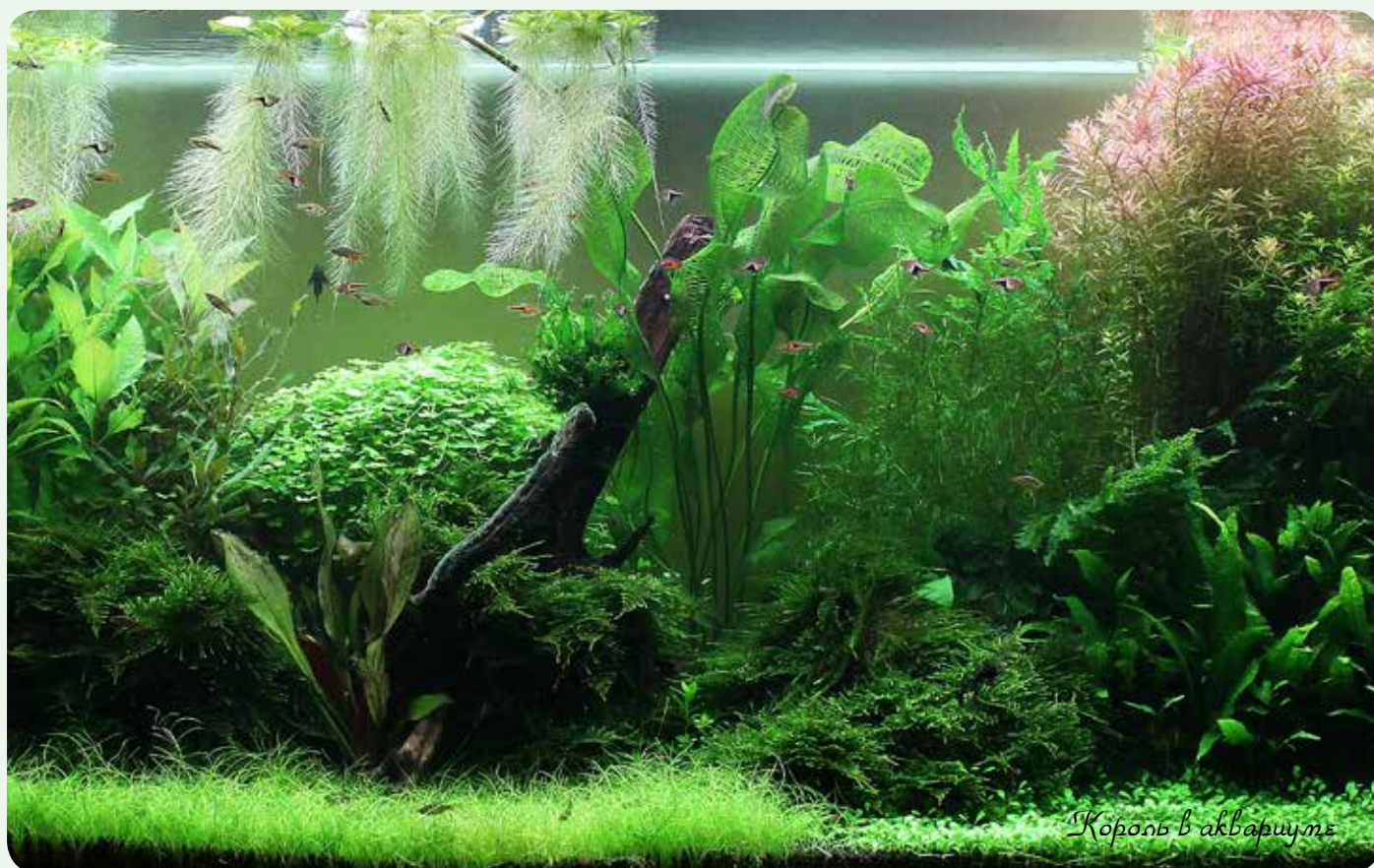
Король в аквариуме