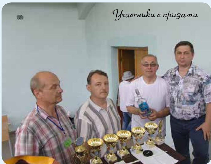
Участники с призами