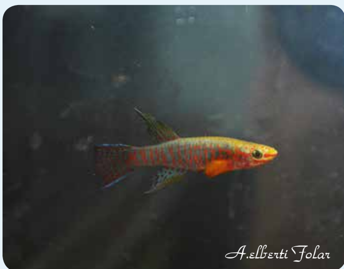
A. elberti Jolar