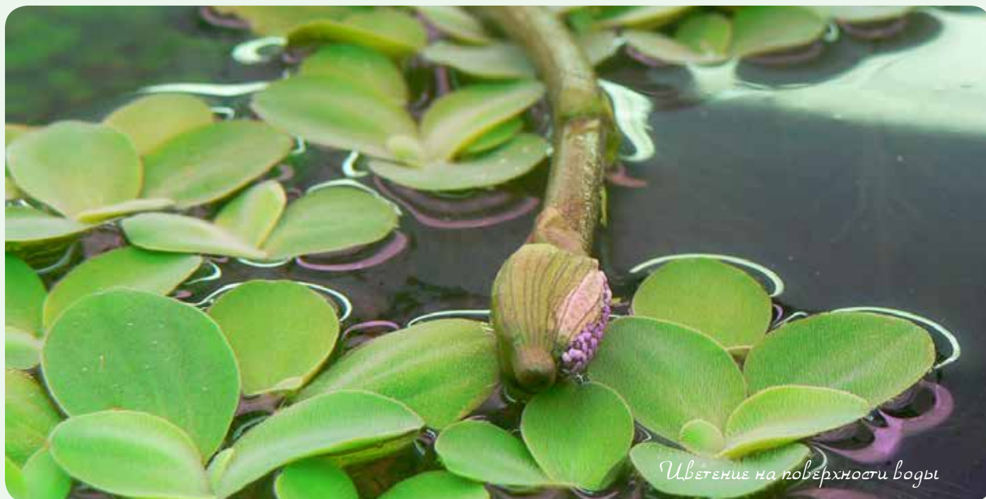
Цветение на поверхности воды

Спустя некоторое время растение удивило меня листом странной формы, который только начал расти. Поливстав фотографии в интернете, стало ясно – мадагаскарец собрался цвести. Во всех изданиях пишут, что, при малом количестве листьев растению нельзя давать цвести, лучше цветоносы срезать, иначе оно может погибнуть из-за нехватки сил. Я решил все же рискнуть,