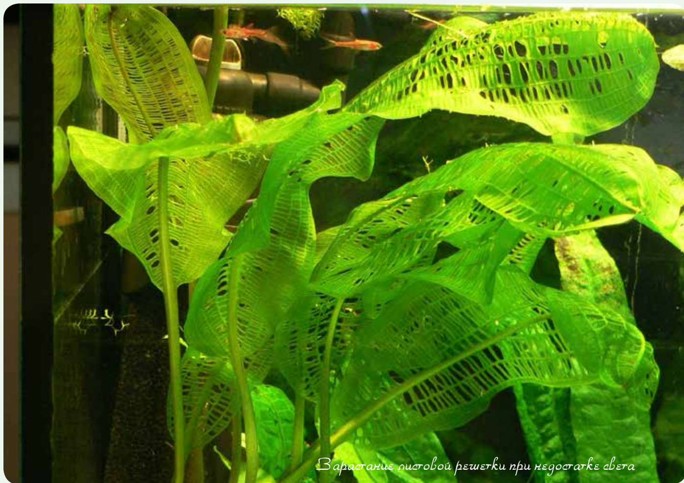
Варстание листовой решетки при недостатке света

Желание приобрести в свою коллекцию увирандру не пропало даже тогда, когда я узнал о требованиях к