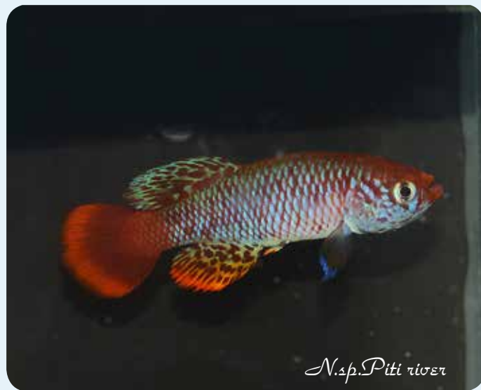
N.sp. Piti river