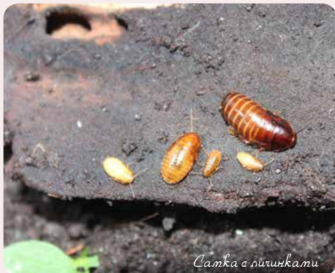
Самка с личинками

Многолетнее увлечение террариумными животными и общение на нескольких русскоязычных сайтах с единомышленниками привело к тому, что со многими террариумистами у меня уже давно завязались дружеские отношения. Мы частенько переписываемся по электронной почте и по возможности пересылаем друг другу животных, которых удалось размножить или достать с некоторым избытком.