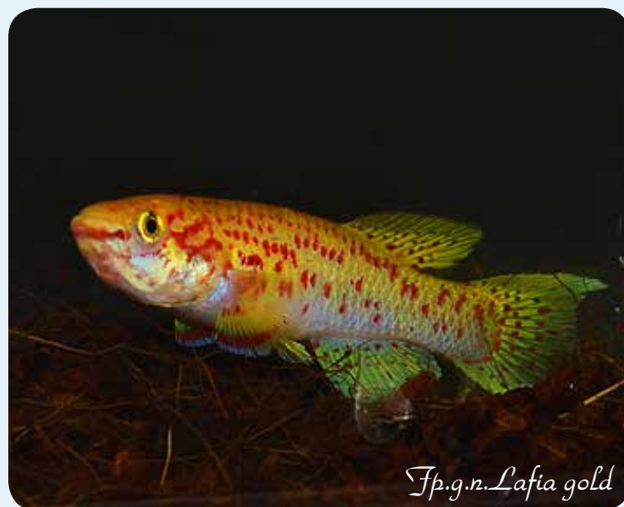
Гр.г.н. Lafia gold